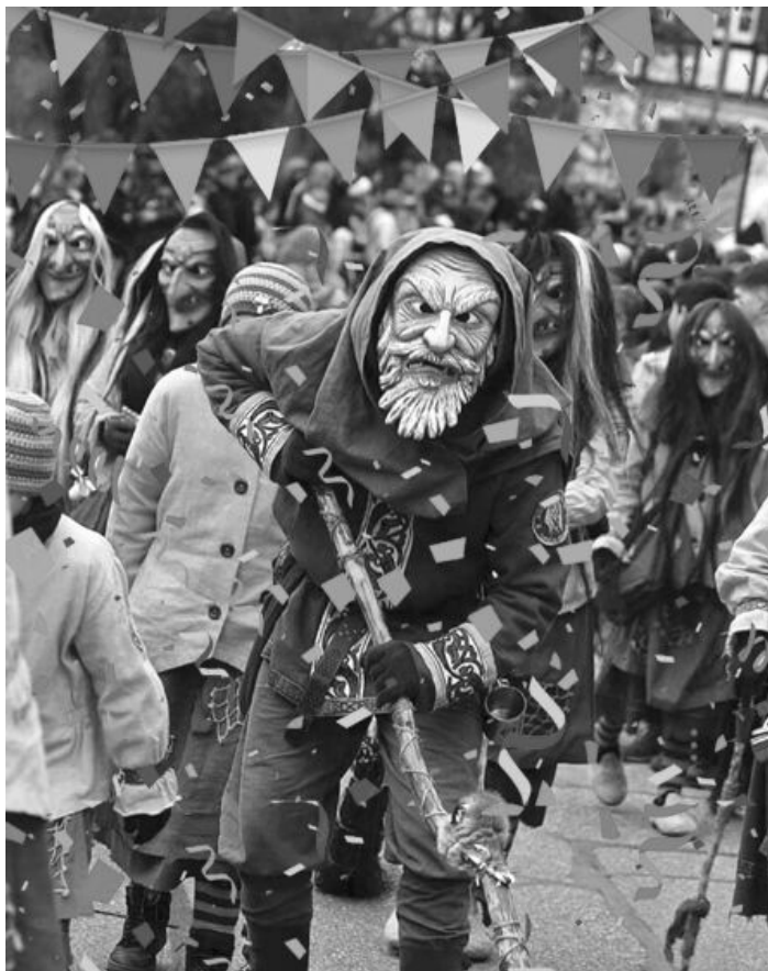
Der Fürschd mit seinen Hexen