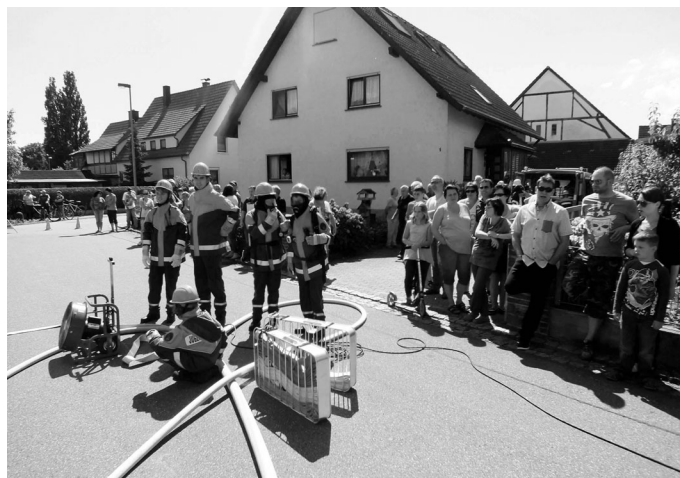
Zahlreiche Zuschauer schauten der Jugendfeuerwehr über die Schulter.