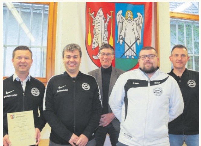
Geehrte Spieler des Tennisclubs Kappel-Grafenhausen