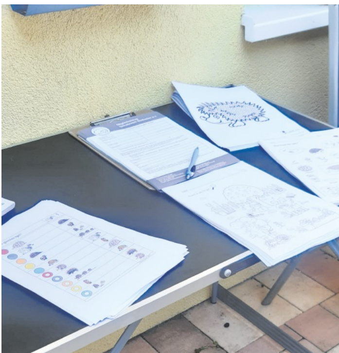
Igelfreunde Südbaden e. V.