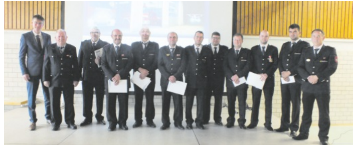
Ehrungen verdienter Feuerwehrangehöriger standen im Mittelpunkt der Jahreshauptversammlung.