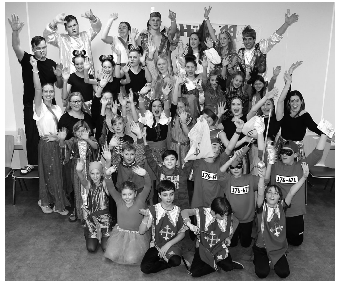
Die TUJU Kappel-Grafenhausen in voller Disney-Montur - Der Spaß ist allen anzusehen.

Nächstes Jahr geht's wieder zum Hüttenwochenende.