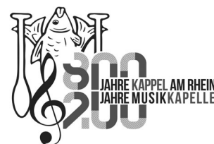
Thomas Schaefers Musikkapelle Kappel