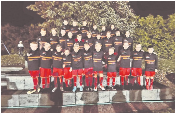
Die E-Junioren der SG Kappel-Grafenhausen

Die Herren 1 bedanken sich bei unseren E-Junioren für die nette Geste beim Derby gegen Grafenhausen. Als Einlaufkinder begleiteten sie unsere Jungs auf den Platz.