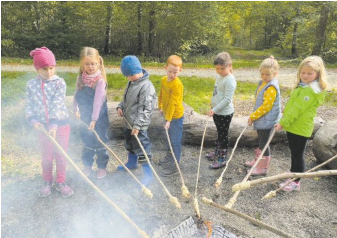
Konzentriert bei der Sache: Die Schulanfänger beim Stockbrot grillen.

Der Vormittag wurde mit einem gemeinsamen Picknick abgeschlossen. Ein aufregender und schöner Vormittag im Wald ging zu Ende, der gleichzeitig der Start für gemeinsame Aktionen der Schulanfänger war. Wir freuen uns auf eine spannende Zeit!