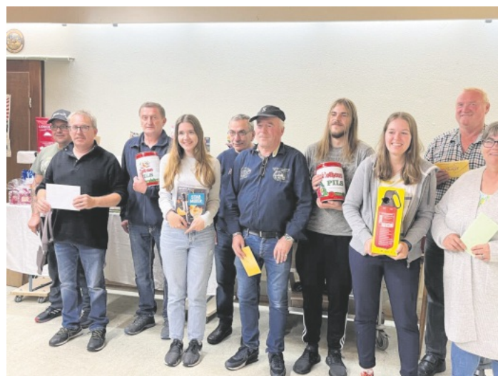
Die erfolgreichsten zehn Glückspilze präsentieren ihren Gewinn!!!

Aufgepasst: Auch wenn am nächsten Montag, den 3. Oktober 2022, ein Feiertag im Kalender steht, hat das Schützenhaus am Sonntagmorgen ab 10:00 Uhr geöffnet.