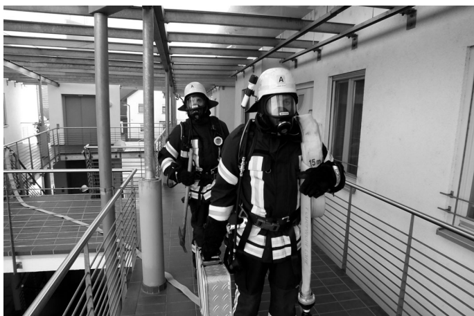
Atemschutzträger im Einsatz (unser Bild).