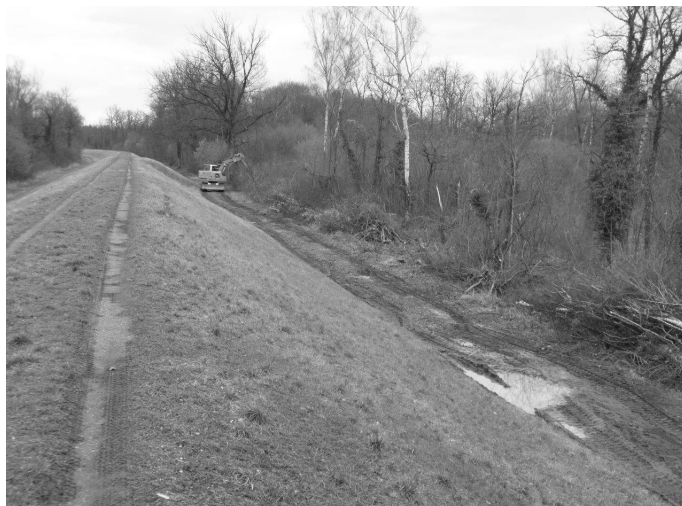
Vorbereitende Rodungsarbeiten für die Sanierung des Hochwasserdamms VI Anfang 2016

Es wird darauf hingewiesen, dass die amtlichen Bekanntmachungen ab heute, während der Dauer von einer Woche, an den Verkündungstafeln beider Rathäuser angeschlagen sind.