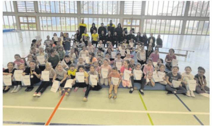
Die glückliche Turnerjugend am Ende der Veranstaltung

Am Ende des Tages waren alle zufrieden. Die Turnerjugend mit dem Geleisteten und der Anerkennung durch die Kampfrichter und die Organisatoren über den reibungslosen Ablauf, die Unterstützung und vor allem über die glücklichen Gesichter der Turnerjugend.