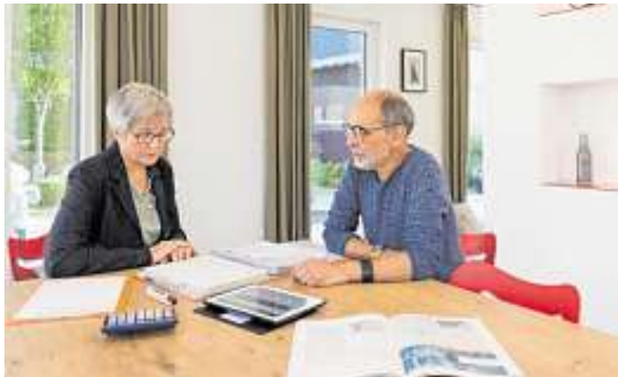
Energetische Sanierungsmaßnahmen lassen sich auch 2022 von der Steuerlast abziehen

Klima und Energiewirtschaft Baden-Württemberg geförderte Informationsprogramm berät gewerkeneutral, fachübergreifend und kostenfrei. Zukunft Altbau hat seinen Sitz in Stuttgart und wird von der KEA Klimaschutz- und Energieagentur Baden-Württemberg umgesetzt.