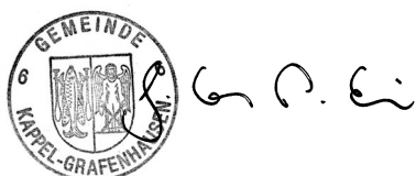
Jochen Paleit Bürgermeister