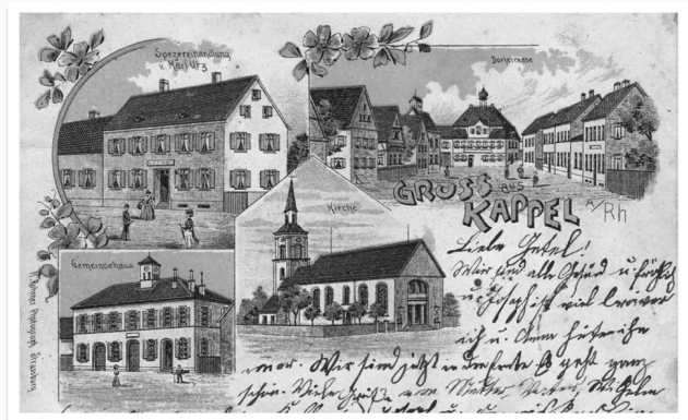
Postkarte (als Lithographie – Steindruck) um 1900 Oben links: Ehemalige Spezereihandlung Karl Utz, Rathausstraße 9