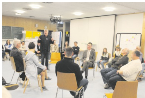
Schließlich wurden die Ideen der Bürgerschaft gemeinsam mit Bürgermeister und Gemeinderäten diskutiert.