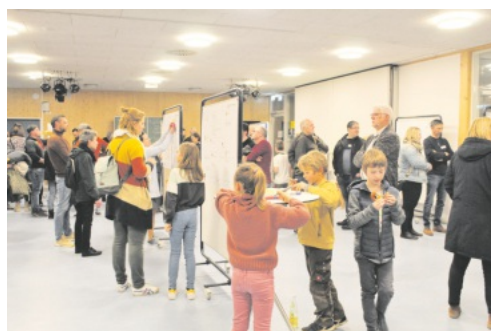
Die in den Workshops gesammelten Ideen wurden präsentiert und weiterentwickelt.