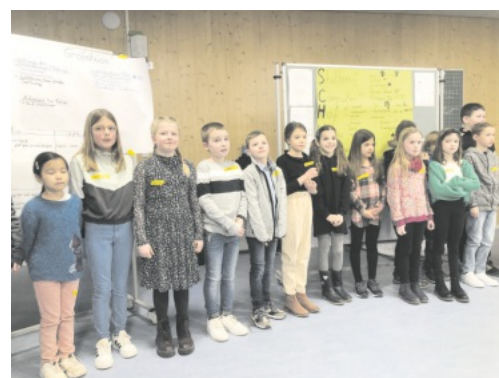
Gemeinsam stellten die Kinder und Jugendlichen ihre Arbeitsergebnisse vor.