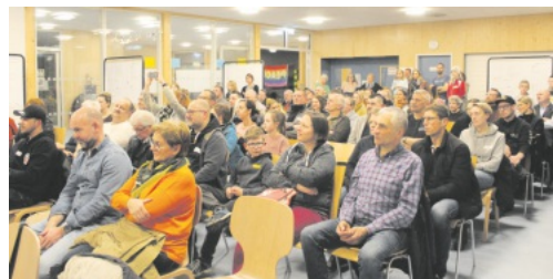
Sehr gut besucht war die Abschlussveranstaltung zum Bürgerdialog in der neuen Mensa der Ferdinand-Ruska-Schule.