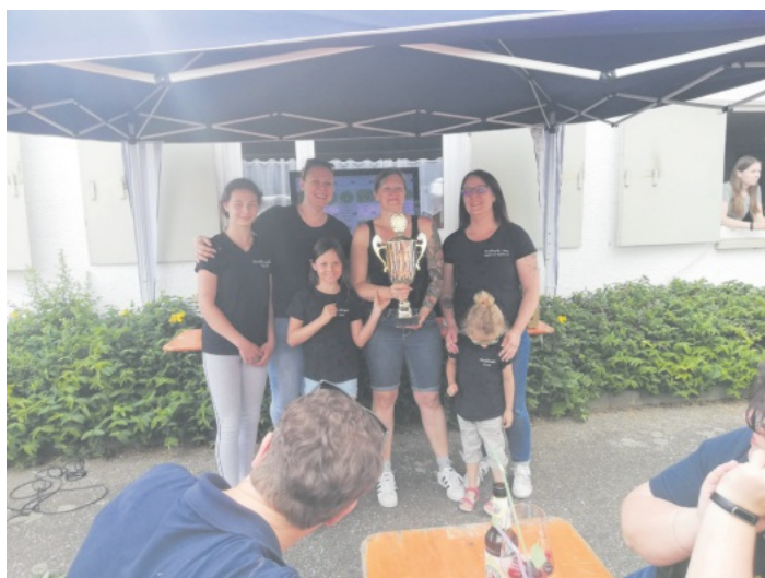
Die Siegerinnen mit Pokal

Am Sonntag, den 12.06.2022 bleibt das Schützenhaus geschlossen, da an diesem Tag die Schützen am Wandertag der Volkssportfreunde teilnehmen.