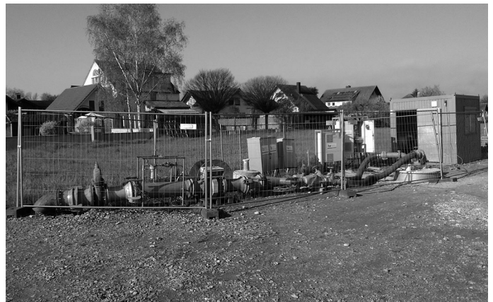
Versuchsbrunnen an der Rittstraße mit Ablaufleitung