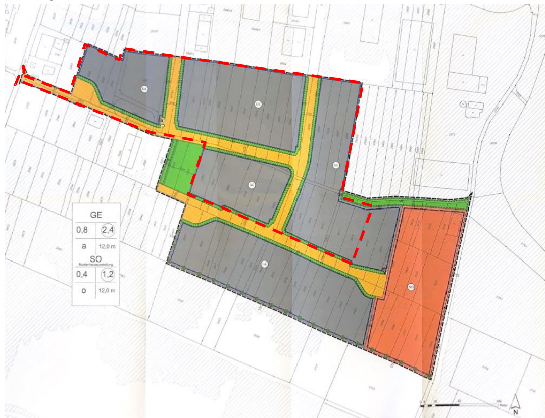
Abb. 1: Planzeichnung des rechtskräftigen Bebauungsplans „Kleinoberfeld III“ mit Abgrenzung der vorliegenden 2. Änderung des Bebauungsplans (rot gestrichelt), o.M.

Der Bebauungsplan „Kleinoberfeld III“ wurde am 14.01.2021 vom Landratsamt Ortenaukreis genehmigt und anschließend rechtskräftig. Dieser stellt die Grundlage für die Erweiterung des bestehenden Gewerbegebiets im Ortsteil Grafenhausen dar und definiert Gewerbegebiete, sowie ein Sondergebiet für die Musterhausausstellung im Osten des Ortsteils.