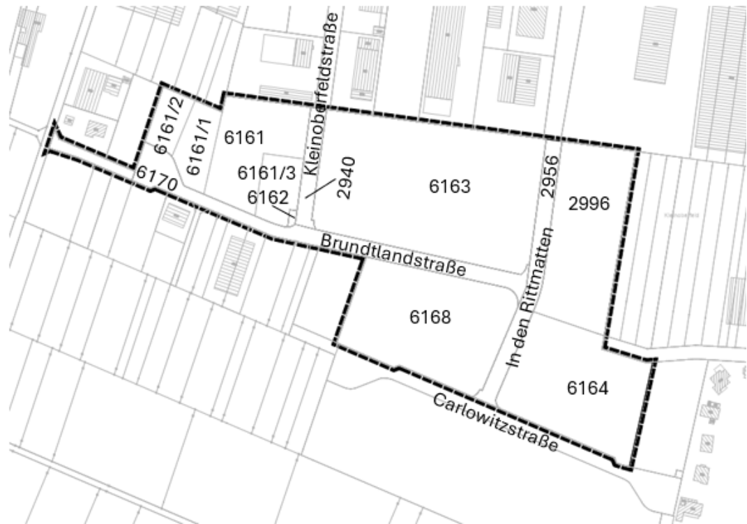
Abb. 2: Kataster mit der Darstellung des Plangebiets der vorliegenden 2. Änderung des Bebauungsplans (genordet, ohne Maßstab)

Das Plangebiet liegt am südöstlichen Rand des Ortsteils Grafenhausen. Im Norden schließt das bestehende Gewerbegebiet Kleinoberfeld an, im Westen, Süden und Osten besteht landwirtschaftliche Nutzung. Östlich des Geltungsbereiches in einer Entfernung von ca. 200 m verläuft die Bundesautobahn 5 in Nord-Süd-Richtung. Das Plangebiet ist heute bereits erschlossen und teilweise bereits gewerblich in Anspruch genommen. Auch die Sonderbaufläche ist bereits bebaut.