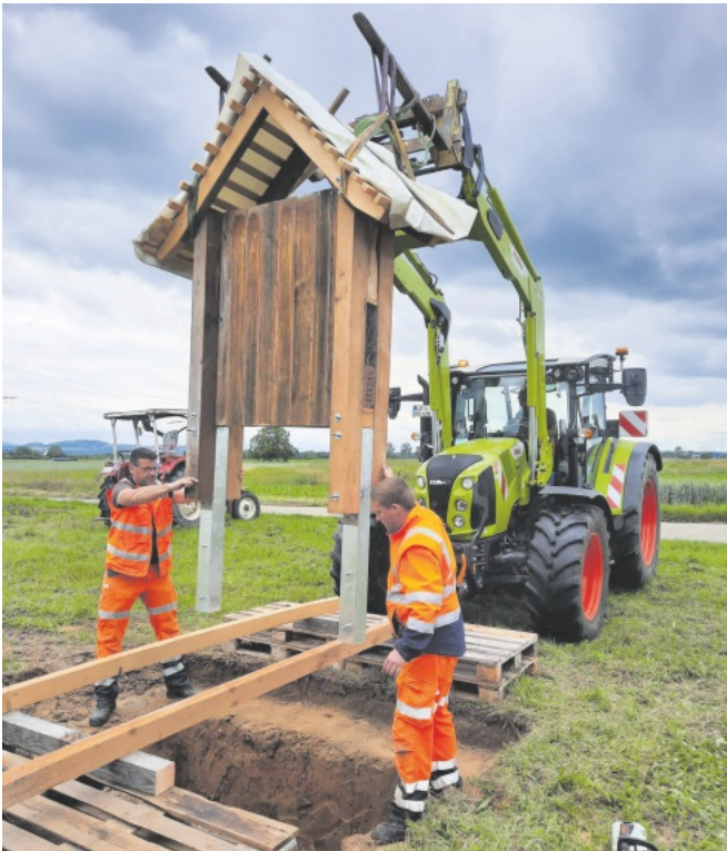
Die Bauhofmitarbeiter unterstützen den OGV Grafenhausen beim Einbetonieren des Insektenhotels.