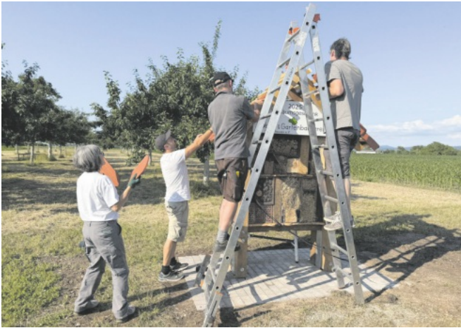
Bau des Insektenhotels