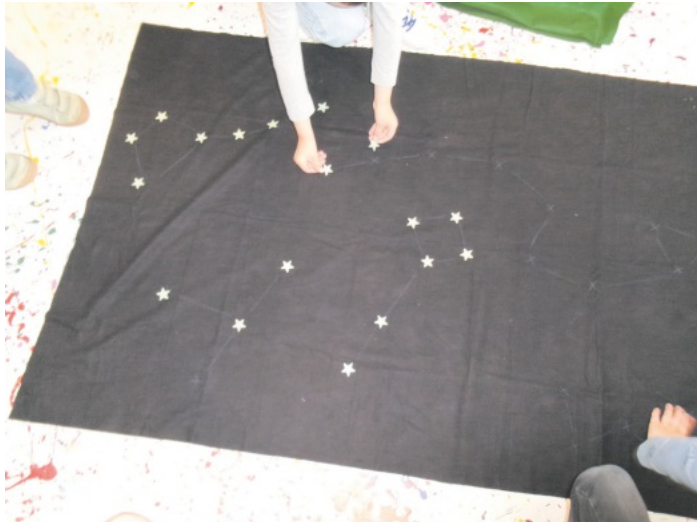
Sternbilder werden gelegt

Danke an unser Schulanfängerteam für die Organisation und Begleitung des Workshops und auch ein Danke an die Talent Academy Rust mit ihrem Team.