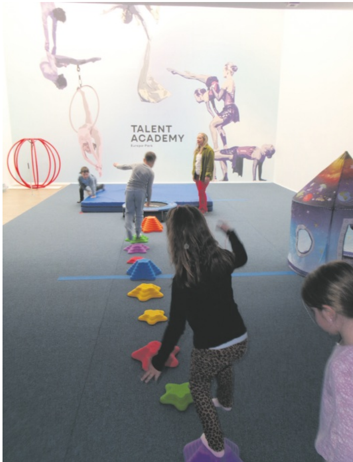
Prüfung für den Weltraumführerschein