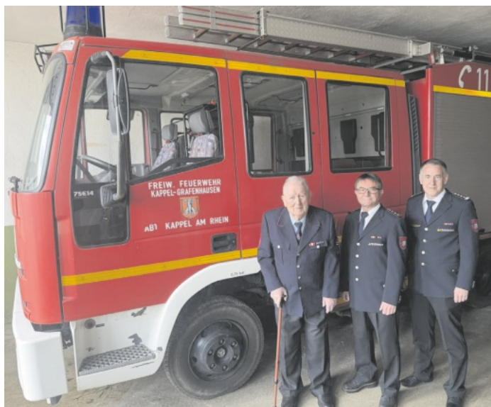
Bericht + Bilder: Rudi Rest

Besonders die gemeinsame Ausbildung und die Gründung der Jugendfeuerwehr 2004 brachten die Kameradinnen und Kameraden enger zusammen. Ein entscheidender Schritt folgte 2011 mit dem Einzug in das gemeinsame Feuerwehrhaus – aus zwei Abteilungen wurde endgültig eine Einheit. Heute steht die Feuerwehr Kappel-Grafenhausen für Zusammenhalt, moderne Einsatzbereitschaft und starkes ehrenamtliches Engagement. Mit Einsatzabteilung, Jugend-, Kinder- und Altersfeuerwehr blickt sie stolz auf 50 Jahre Geschichte – und gleichzeitig motiviert in die Zukunft.