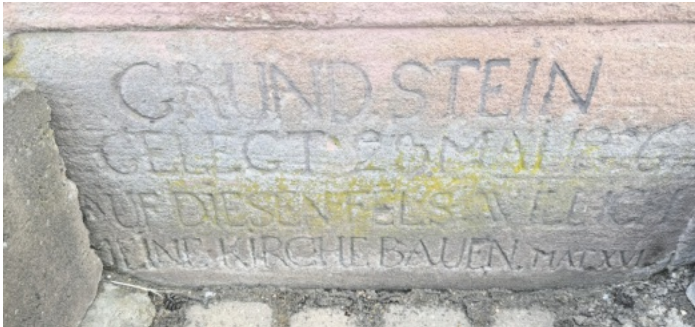
Gut lesbar die Inschrift auf dem Grundstein, welcher vor genau 200 Jahren gelegt wurde.