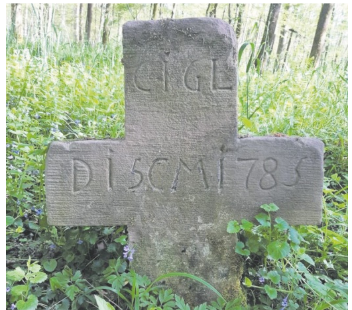
Das kleine Kreuz im Ellenbogenwald

Ci (yprian) GL (ück) D(ie) I(dus) 5 C(hrist) M(onats) 1785