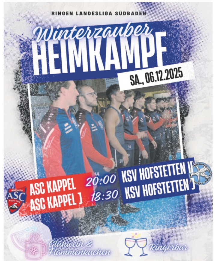
Winterzauber am 06.12.2025

Vorankündigung: Letzter Heimkampf am 20.12.2025 Der letzte Kampf der Saison findet gegen Weitenau-Wieslet II statt.