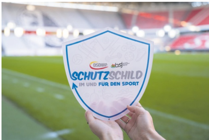
Dem Turnerbund wurde das "Schutzschild im und für den Sport" verliehen

Mit sportlichen Grüßen Die Vorstandschaft