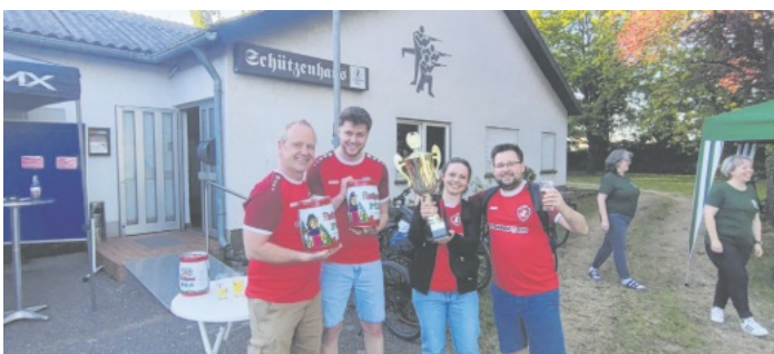
Das Siegerteam 2026