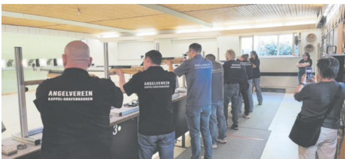
konzentriert + motiviert